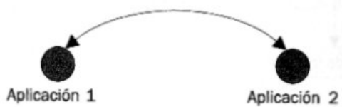
Figura 1: Comunicación punto a punto

En lo referido a seguridad para servicios Web, la seguridad a nivel de transporte se emplea para establecer una seguridad punto a punto : la comunicación es segura desde un punto a otro punto, lo que implica que la conexión sea directa, sin intermediarios. Para lo relativo a servicios Web, intermediarios como los enrutadores de Internet no se consideran intermediarios, ya que estos han sido diseñados para soportar la seguridad a nivel de transporte.